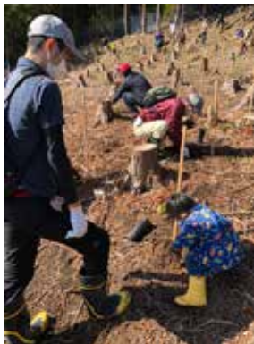
社会奉仕活動「天使の森 植樹」(地区補助金奉仕活動)での植樹活動(2020年11月3日撮影)

手探りながらも例会を運営できるようになると、次はロータリアンにとって大切な「奉仕活動」と「親睦活動」をコロナ禍でどのように行うか、を考えました。